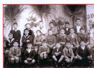
La solitude... Le collège de Bordighera... Il s'appelle "Léo 38" La musique, déjà : il entend la "Symphonie de Beethoven" dans un salon de thé... en 33, il voit Ravel diriger au Casino de Monte-Carlo...